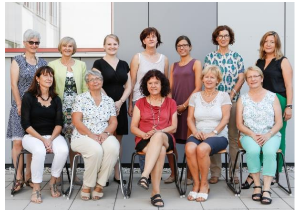
Die Lehrkräfte des Fachbereichs Kinderpflege.